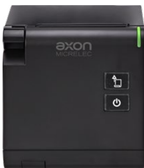
Uscita carta frontale