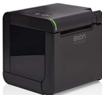
Uscita carta superiore