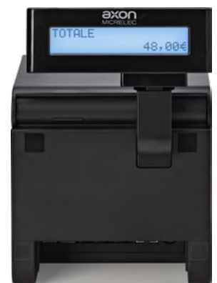
Display cliente integrato